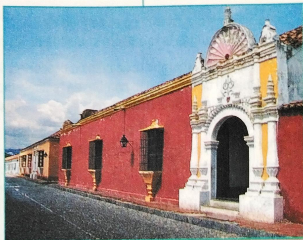
Casa Colonial en Coro