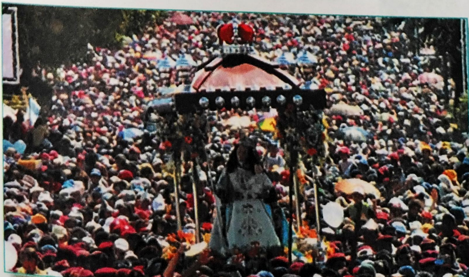
Procesión de la Divina Pastora. Desde la Iglesia de Santa Rosa, rumbo a la Catedral de Barquisimeto

En nuestro país han existido personas que hoy son ejemplo de vida para muchos venezolanos en el ámbito religioso, tal es el caso del Siervo de Dios José Gregorio Hernández, de la Beata María de San José y de la Madre Candelaria de San José. Merece especial mención la devoción que rinde gran parte de la población a la Virgen María en sus distintas advocaciones: de Coromoto, la Chiquinquirá, la Divina Pastora, del Valle, Auxiliadora, del Carmen, entre otras. Una de las manifestaciones más importantes lo constituye la procesión de la Divina Pastora que se realiza durante el mes de enero en el Estado Lara a la cual concurren más de un millón de personas desde todos los confines del territorio nacional.