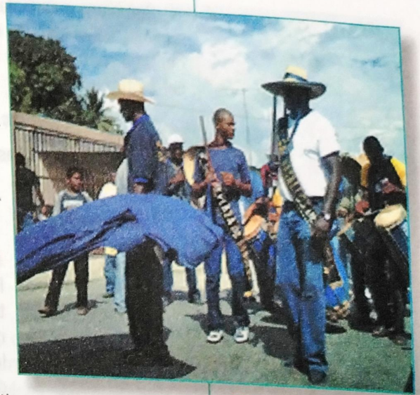
Fiesta de San Benito

El pueblo de Venezuela en gran porcentaje pertenece y practica la religión católica. Sin embargo, existen otras religiones como la ortodoxa y las protestantes que son practicadas por otros grupos de personas en ejercicio de la libertad de culto establecido en la Constitución y las leyes. Sin embargo, con el pasar de los años han ido ingresando al país otros grupos religiosos de orden ortodoxo o protestante, lo que se llama la Libertad de Cultos consagrada en el Título III referido a los Derechos Civiles, artículo 59 de la Constitución Bolivariana de Venezuela.